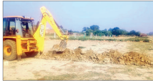
भिवानी। अवैध कॉलोनी को तोड़ती जेसीबी मशीन।

अवैध निर्माण हटाओ अभियान के तहत नगर योजनाकार विभाग द्वारा मौजा लोहड़ भिवानी में भिवानी-त्रिवेणी रोड पर लगभग चार एकड़ में फैली अवैध कॉलोनी में अवैध निर्माण को तोड़ा गया। हालांकि कुछ लोगों ने इसका विरोध किया, लेकिन भारी पुलिस बल की मौजूदगी के चलते डीटीपी का अभियान जारी रहा। जिला नगर योजनाकार अधिकारी ने बताया कि विभाग द्वारा