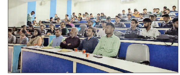
चरखी दादरी। नशामुक्ति कार्यक्रम में उपस्थित विद्यार्थी।