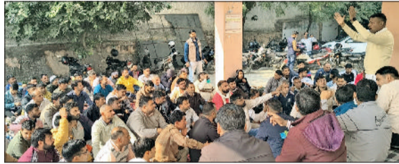
भिवानी। मांगों को लेकर धरने पर बैठे कर्मचारियों को संबोधित करते वक्ता।

हरियाणा गवर्नमेंट पीडब्ल्यूडी मैकेनिकल वर्कर्स यूनियन (रजि. नं. 41) से संबंधित सर्व कर्मचारी संघ हरियाणा की आईबी जूई सिविल और आईबी सौरखी ब्रांचों ने वीरवार को बड़ चौक स्थित सिंचाई विभाग को बड़ चौक स्थित सिंचाई विभाग के कार्यालय के समक्ष संयुक्त अनिश्चितकालीन धरना प्रदर्शन शुरू कर दिया। यह धरना एक्सईन जूई डिवीजन और एक्सईन भिवानी डिवीजन के अधिकारियों के खिलाफ किया, जिसमें कर्मचारियों की विभिन्न लंबित मांगों को तत्काल पूरा करने की मांग की गई। अध्यक्षता