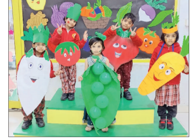
भिवानी। लिटिल हार्ट्स में सब्जियों की वेशभूषा में विद्यार्थी।