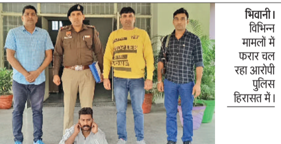
भिवानी। विभिन्न मामलों में फरार चल रहा आरोपी पुलिस हिरासत में।