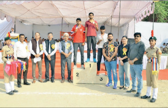
भिवानी। प्रतिभागियों को सम्मानित करते हुए तथा आयोजित प्रतियोगिता में लंबी छलांग लगाता एक प्रतिभागी।